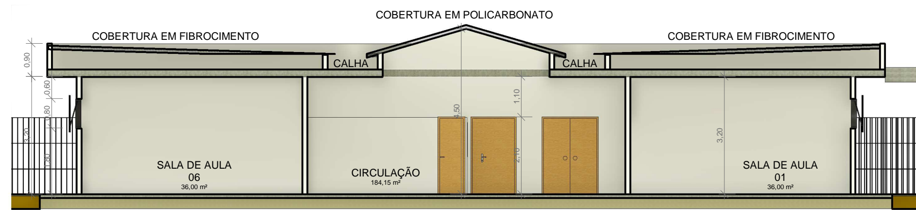
4 CORTE B-B ESCALA 1:100